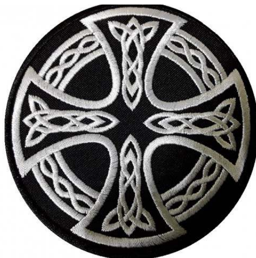
Рисунок 2. Кельтский крест. Символ многих расистских организаций