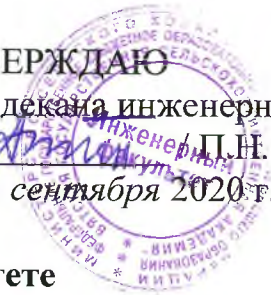
График проведения практик на инженерном факультете в 2020/2021 учебном году обучающимися очной формы обучения